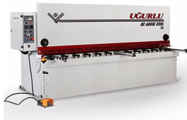
Ürün Cnc Hidrolik Giyotin