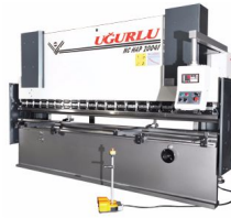
Ürün Cnc Hidrolik Pres