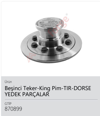
Ürün Beşinci Teker-King Pim-TIR-DORSE YEDEK PARÇALAR