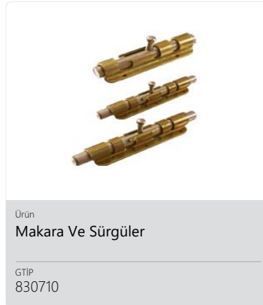
Ürün Makara Ve Sürgüler