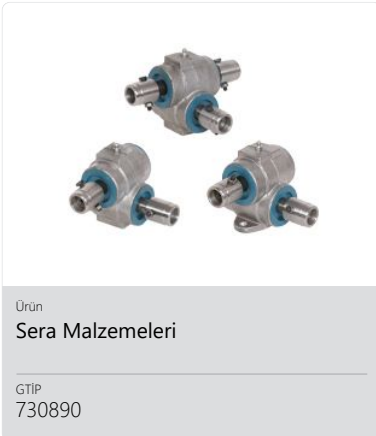
Ürün Sera Malzemeleri