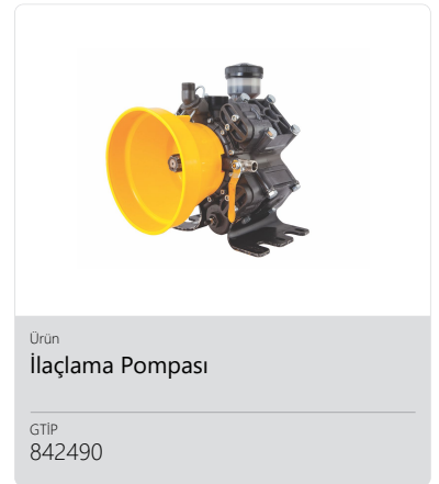
Ürün İlaçlama Pompası