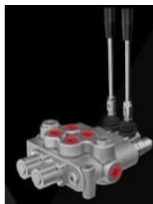
Ürün Hidrolik Yön Kontrol Valfi