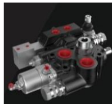
Ürün Kamyon Valfi