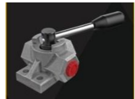
Ürün 3 Yollu Vana