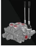
Ürün Hidrolik Yön Kontrol Valfi