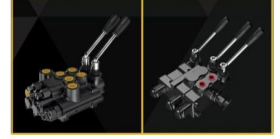
Ürün Traktör Valfi