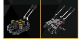
Ürün Traktör Valfi