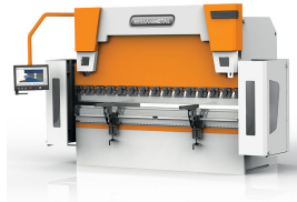
Ürün Cnc Abkant Büküm