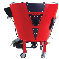
Ürün Yem Karma Ve Dağıtma Makinesi