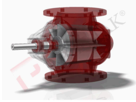
Ürün hava kilidi