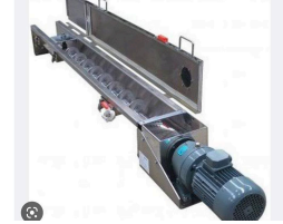
Ürün vidalı helezon