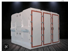
Ürün kare elek