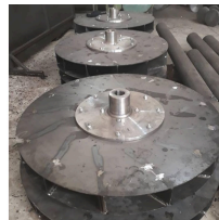
Ürün aspiratör fanı