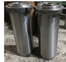
Ürün vinç tamburu