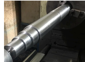
Ürün kare elek mili