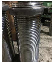
Ürün vinç tamburu