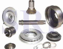
Ürün Makina Parçaları