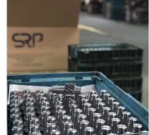
Ürün Makina Parçaları