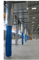
Ürün Havalandırma Sistemi