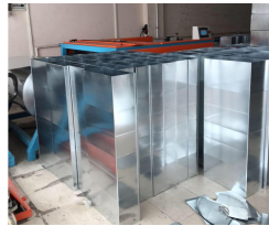
Ürün Havalandırma Sistemi