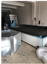
Ürün Havalandırma Sistemi