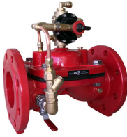
Ürün Manuel Kontrol Vanası