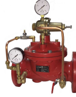
Ürün Hidrolik Kontrol Vanası