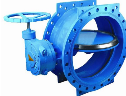
Ürün Kelebek Vana