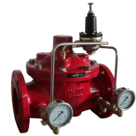
Ürün Basınç Düşürücü Kontrol Vanası