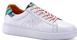
Ürün 2246-1 SPOR DERİ AYAKKABI