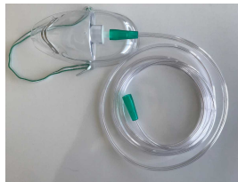
Ürün Oksijen Maskesi