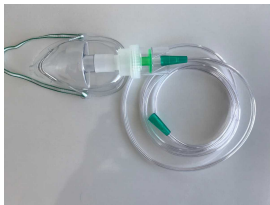
Ürün Nebulizatör Set