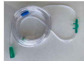
Ürün Nazal Oksijen Kanül