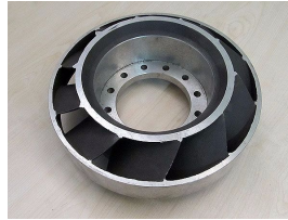
Ürün Otomotiv Yedek Parçası