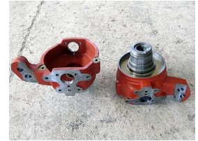
Ürün Otomotiv Yedek Parçası